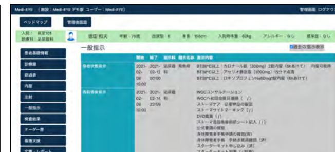
内服・注射・一般指示